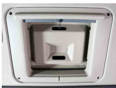
Люк в крыше