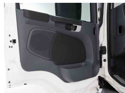
Внутренняя сторона дверей