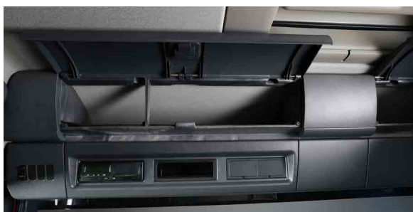
Верхние вещевые полки