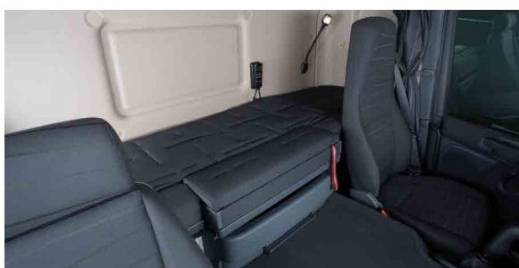
Комфортабельное спальное место