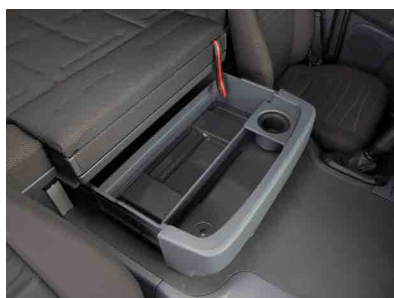
Задний вещевой ящик