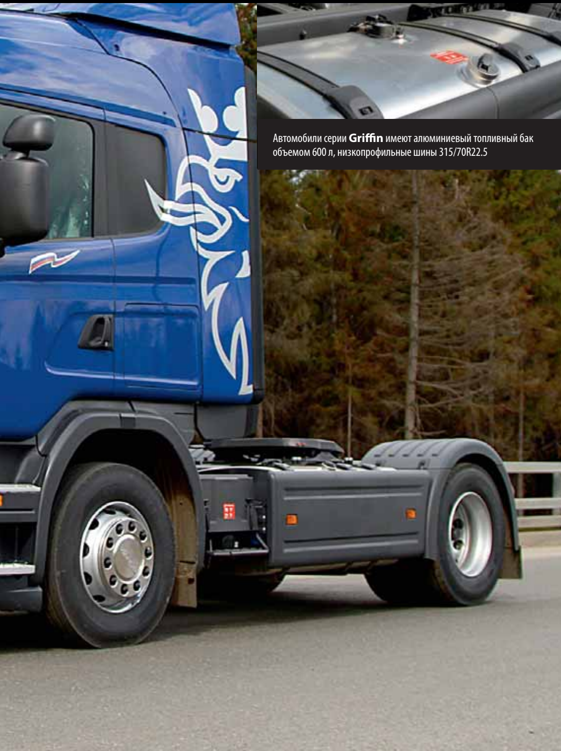
Автомобили серии Griffin имеют алюминиевый топливный бак объемом 600 л, низкопрофильные шины 315/70R22.5

Максимальная эффективность автомобиля достигается с применением системы Opticruise.