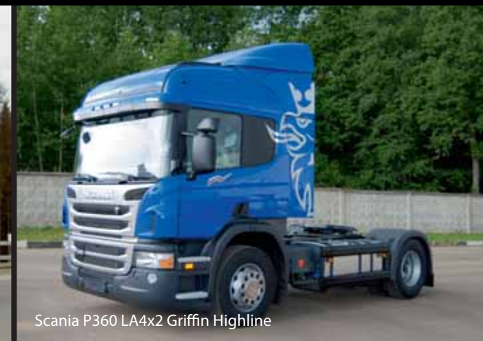
Scania P360 LA4x2 Griffin Highline