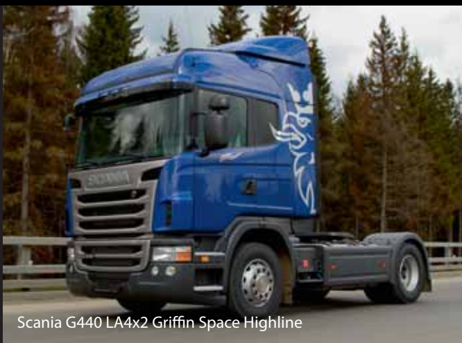
Scania G440 LA4x2 Griffin Space Highline

Тяжелый седельный тягач Scania P440 CA6X4HSZ Griffin Camel