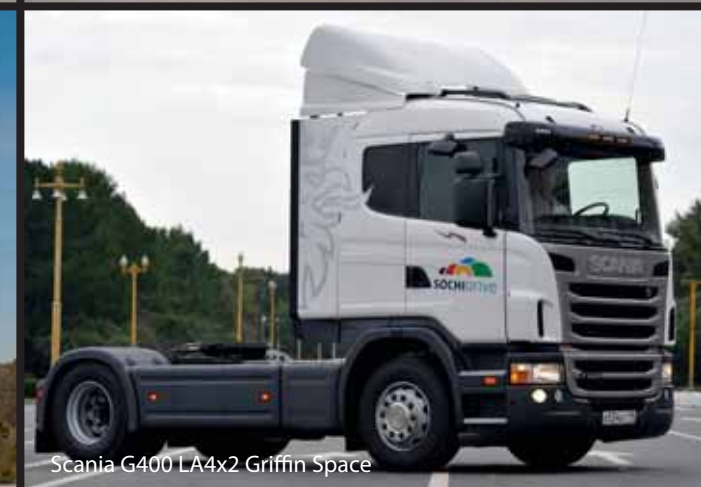
Scania G400 LA4x2 Griffin Space