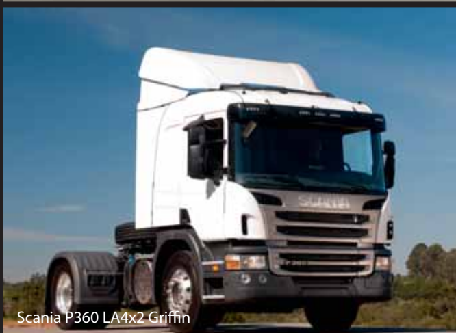
Scania P360 LA4x2 Griffin