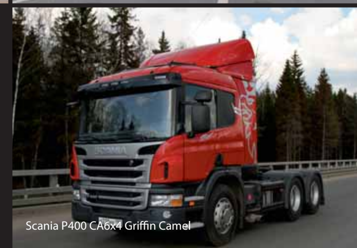
Scania P400 CA6x4 Griffin Camel