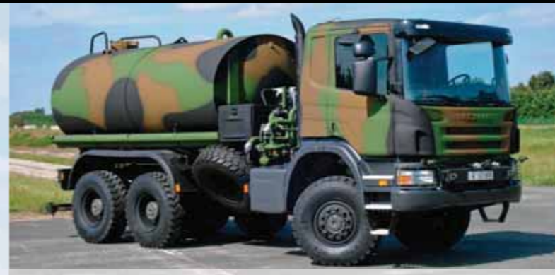
Грузовик Scania 6x6 с цистерной для воды, МО Франции