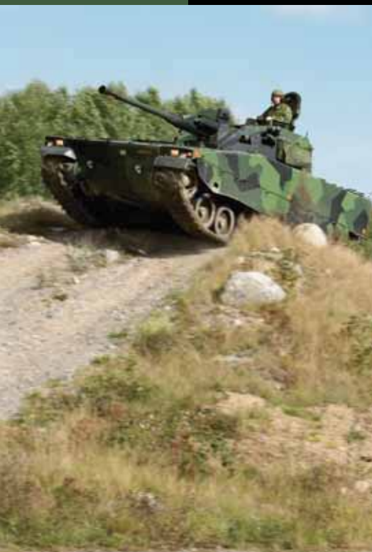
Боевая машина пехоты Hägglunds CV90, двигатель Scania D116