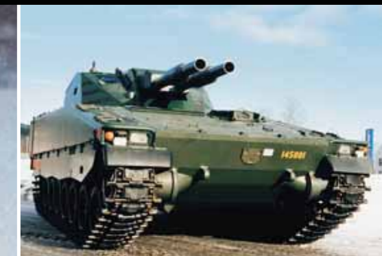
Боевая машина пехоты Hägglunds CV90, двигатель Scania D116