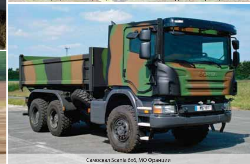
Самосвал Scania 6x6, МО Франции