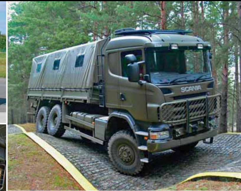
Транспортер Scania 6x6 для перевозки личного состава и грузов, МО Ирландии