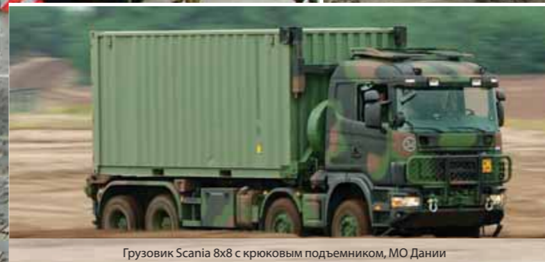
Грузовик Scania 8x8 с крюковым подъемником, МО Дании