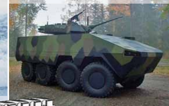
Бронетранспортер Patria AMV (бронированная модульная машина), двигатель Scania D12