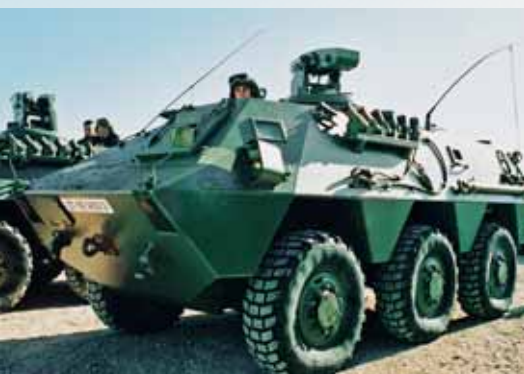
Бронетранспортер BMR, двигатель Scania D9