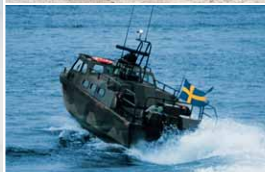
Быстроходный десантный катер 90Е, кораблестроительная компания Storebro, двигатель Scania D114